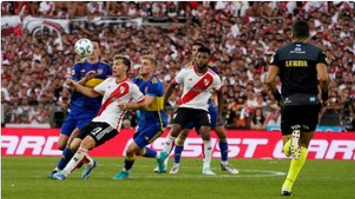
River vs Boca: cuándo es el Superclásico por la Copa de la Liga, a qué hora juegan, la cancha y todo lo que tenés que saber