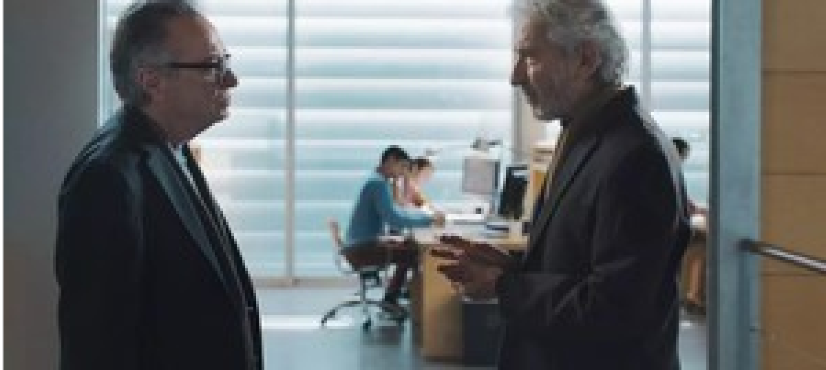
El duelo actoral entre Oscar Martínez y José Sacristán, una obra de arte en medio de "Bellas artes"