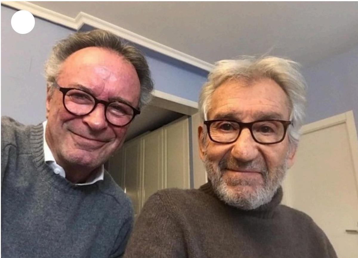
Oscar Martínez junto a José Sacristán

"¿Sabés? Algunos colegas me dicen que yo de joven ya decía que deseaba vivir en Europa. No recuerdo haberlo verbalizado fehacientemente, pero se ve que en algún lugar del bolillero estaba eso"