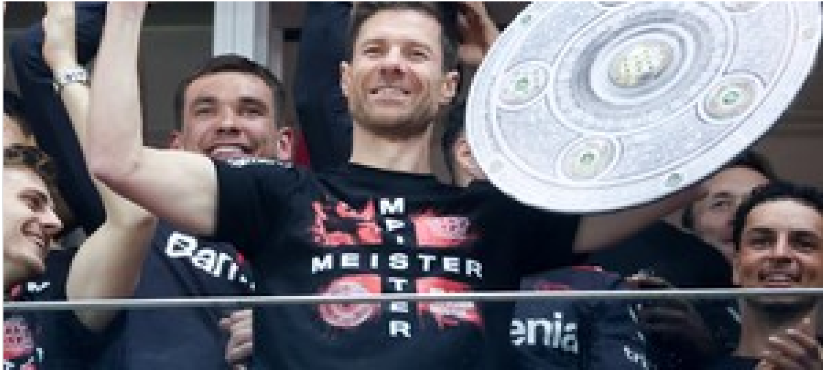
Xabi Alonso, un especialista en milagros: de la épica remontada en Estambul al inédito Bayer Leverkusen campeón de Alemania