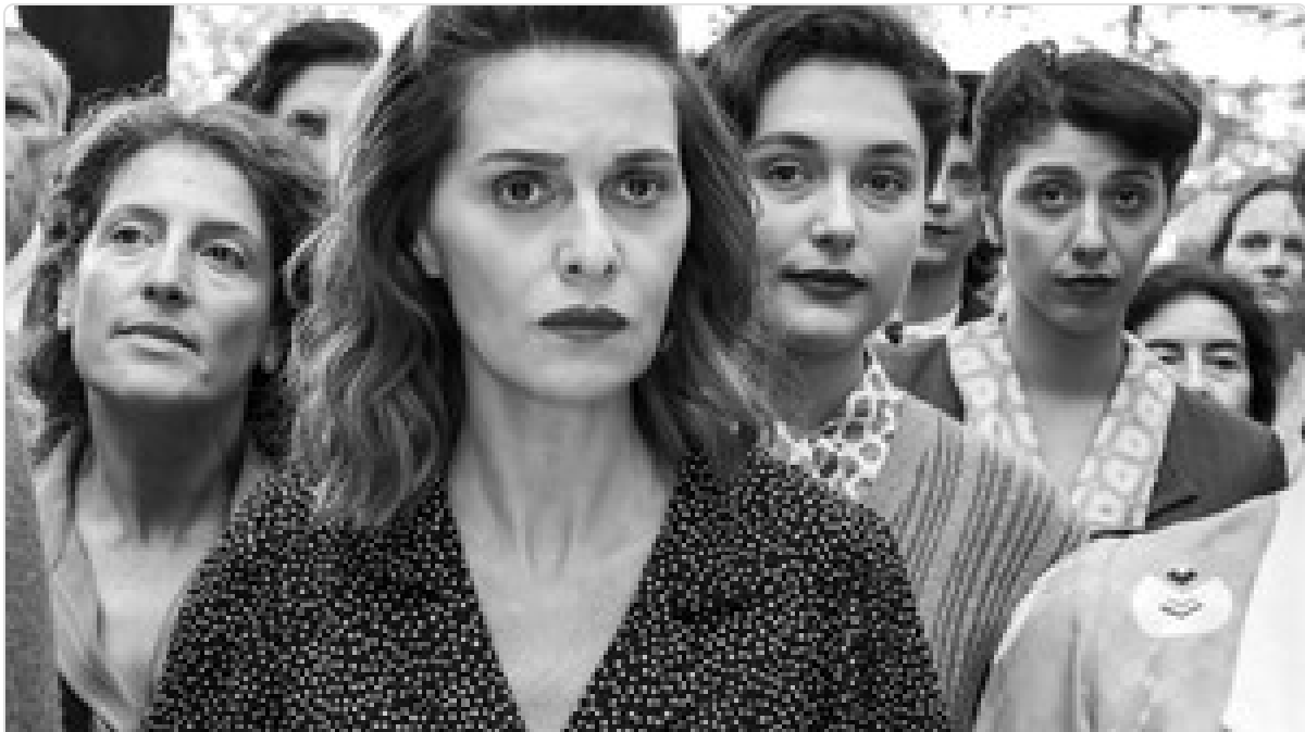
El machismo a la italiana: ¿comedia o tragedia?