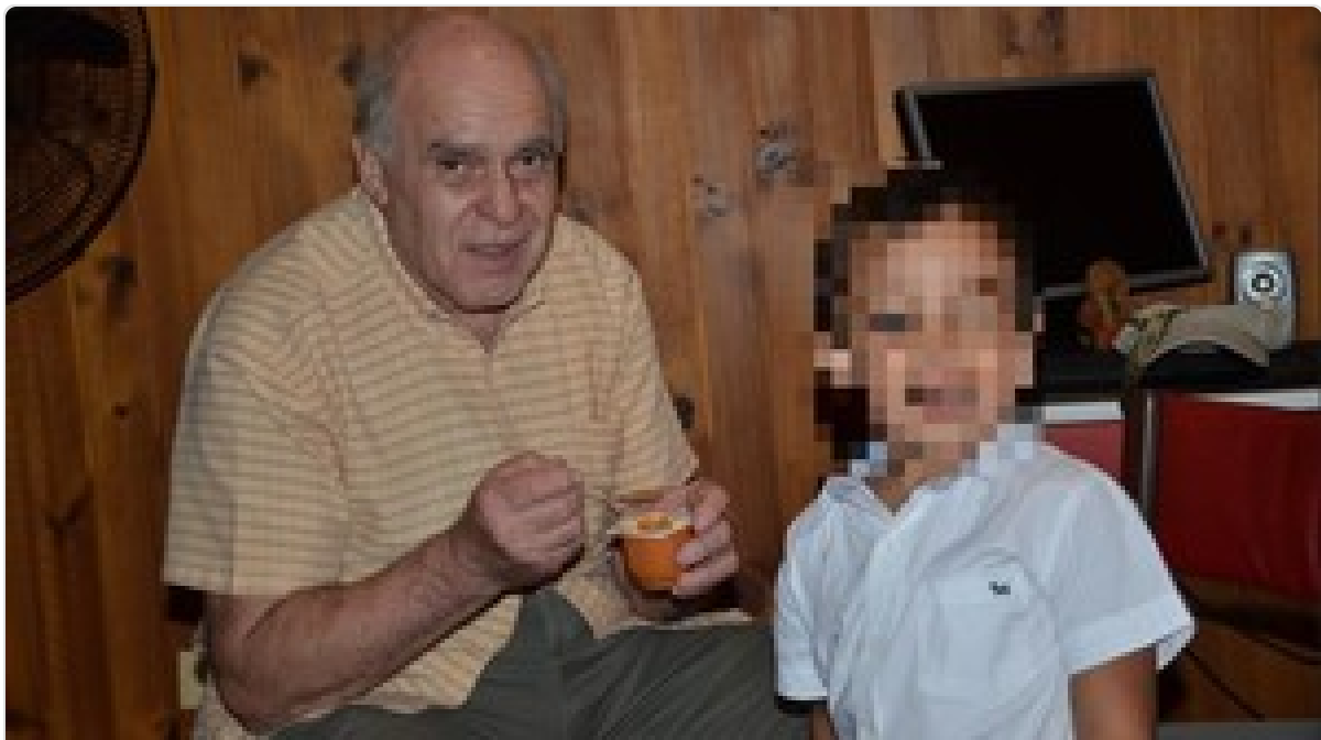
Se fue a vivir a EE. UU. y una llamada le heló la sangre: "Mataron a tu papá"