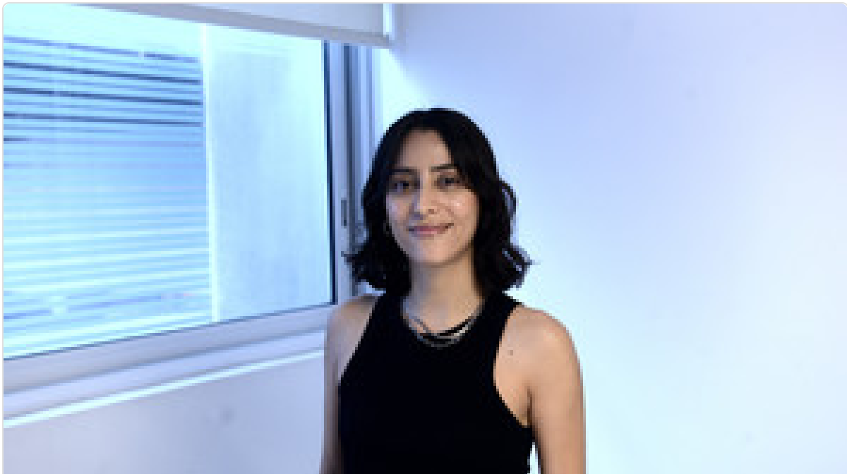
El nuevo y demandado beneficio que cada vez más empresas les dan a sus empleadas