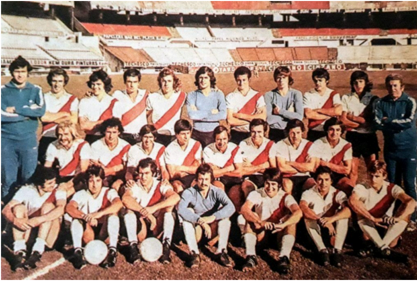
EL PLANTEL COMPLETO DE RIVER CAMPEÓN DE 1975, TRAS 18 AÑOS DE SEQUÍA