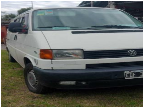
Volkswagen Transporter Furgoneta / Utilitario, 300000Kms., Año: 2003 , Combustible: Diesel, Precio: Consultar