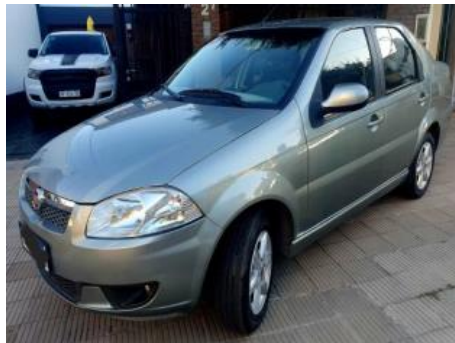
Fiat Siena Atractiva 1.4 Full Full Berlina / Sedan, 75400Kms., Año: 2016 , Combustible: Nafta, Precio: US$8900