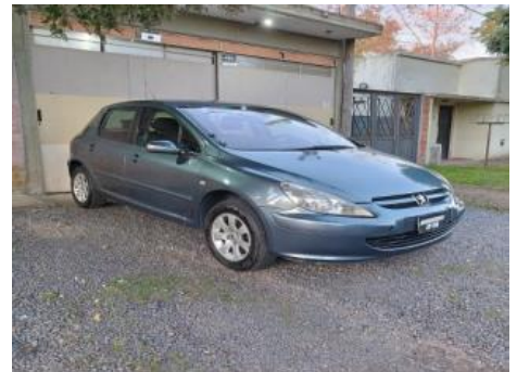
Peugeot 307 XS PREMIUM 2.0 Hatchback, Año: 2006 , Combustible: Nafta, Precio: Consultar