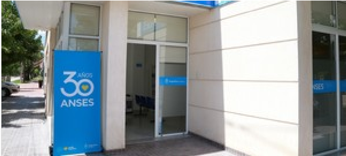
El Gobierno desdobra el pago de jubilaciones y pensiones en abril