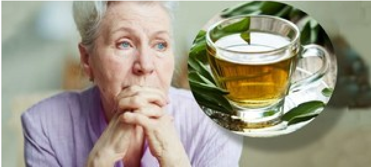
Té de salvia para cuidar el cerebro y mejorar la memoria: cómo se prepara