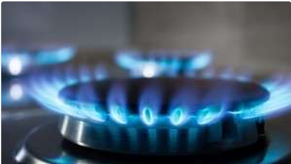
Tarifas de gas: quiénes pierden los subsidios y cómo son los aumentos que se vienen en abril