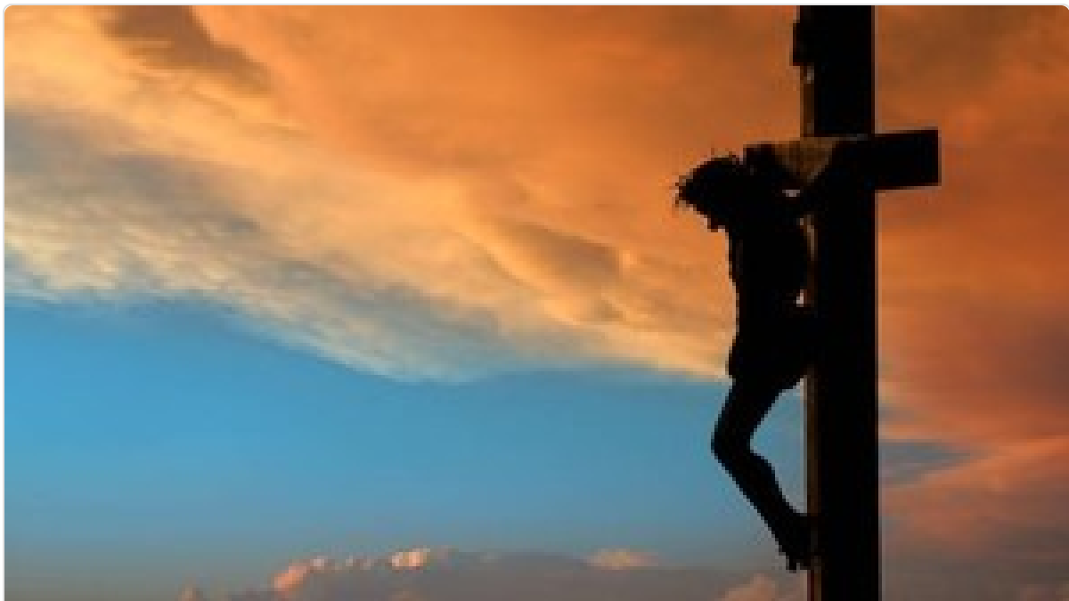
Vía crucis de Semana Santa: cuáles son las 14 estaciones, qué significan y cómo rezar en cada una