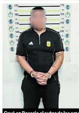
Cayó en Rosario el autor de las amenazas a DI María

El anuncio lo hizo la Cancillería colombiana a través de un comunicado. El Ministerio de Relaciones Exteriores en un momento del gobierno de Colombia, expresó que "repudia las declaraciones hechas por el señor Javier Milei, Presidente de Argentina, en una entrevista al canal CNN en las que se expresaron temas de carácter racista y xenofóbico". El responsable de la Cancillería colombiana, expresó que "repudia las declaraciones hechas por el señor Javier Milei, Presidente de Argentina, en una entrevista al canal CNN en las que se expresaron temas de carácter racista y xenofóbico".