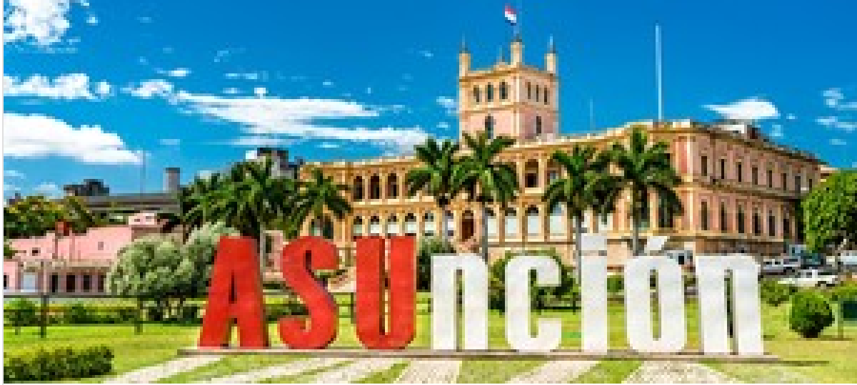
Una escala de 36 horas en Asunción: qué recorrer en la capital de Paraguay y dónde comer