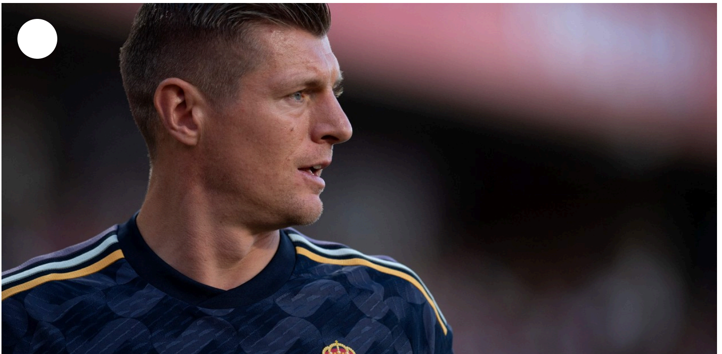
Toni Kroos deja el fútbol a mediados de 2024.

Lo hizo a través de su podcast y generó conmoción entre los fanáticos del Merengue. Se despedirá tras la Eurocopa que jugará para Alemania en su país. Tiene apenas 34 años.