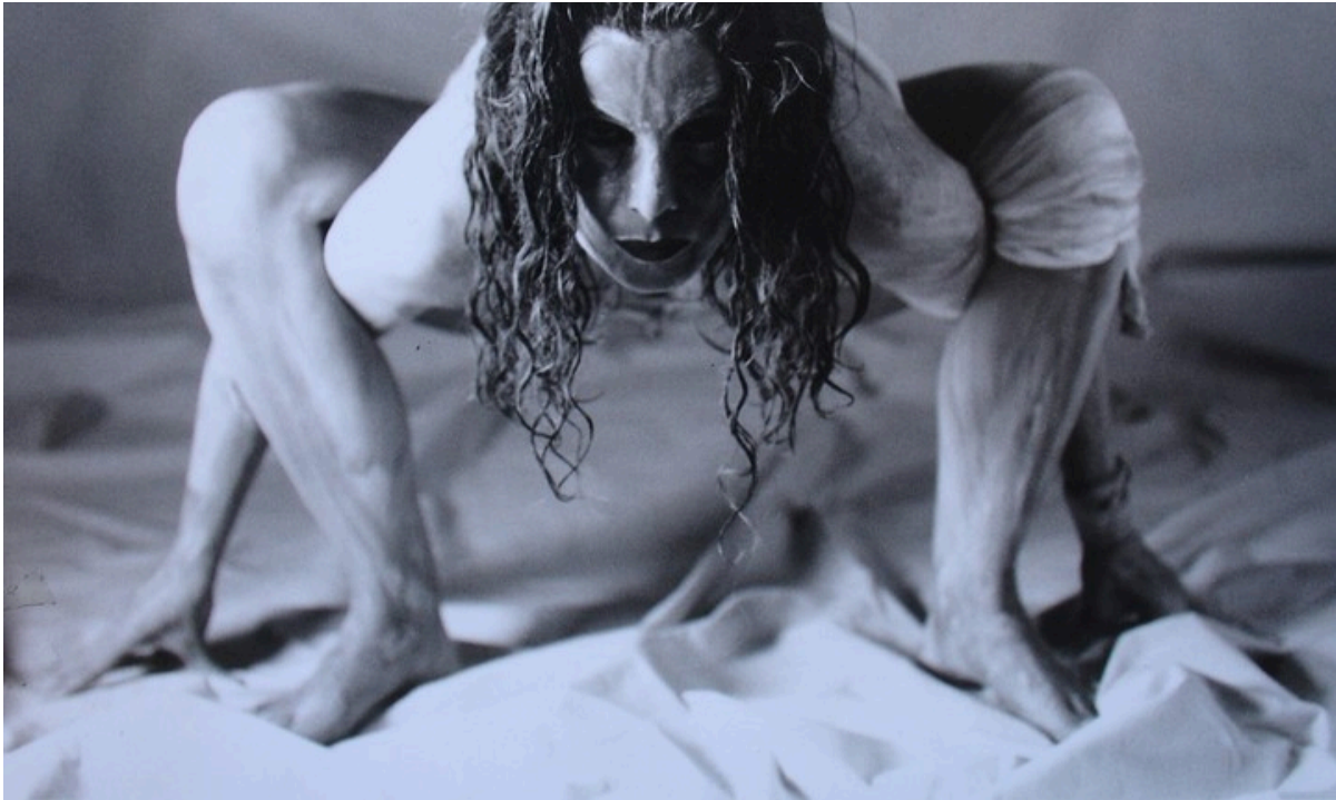
Katja Alemann en una obra under de la década del '80.