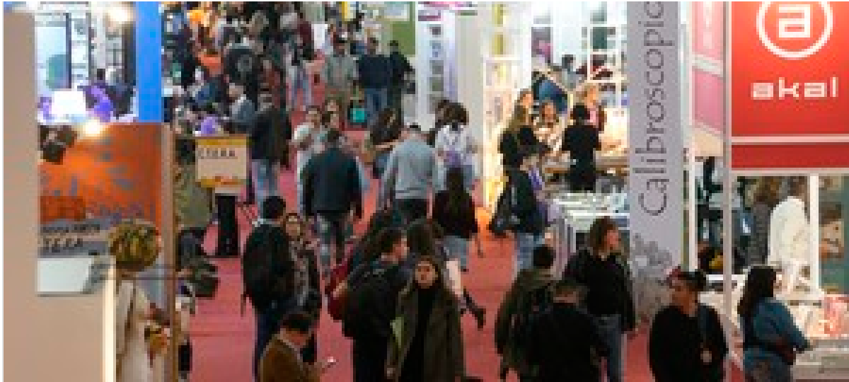
Feria del Libro 2024: programa para el fin de semana del 27 y 28 de abril