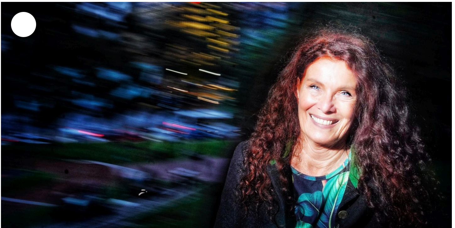
Katja Alemann, ahora incursionando nuevamente en el mundo de la música.

La talentosa actriz y ex vedette retomó sus viejas ganas de hacer canciones y armó el grupo Shambala.