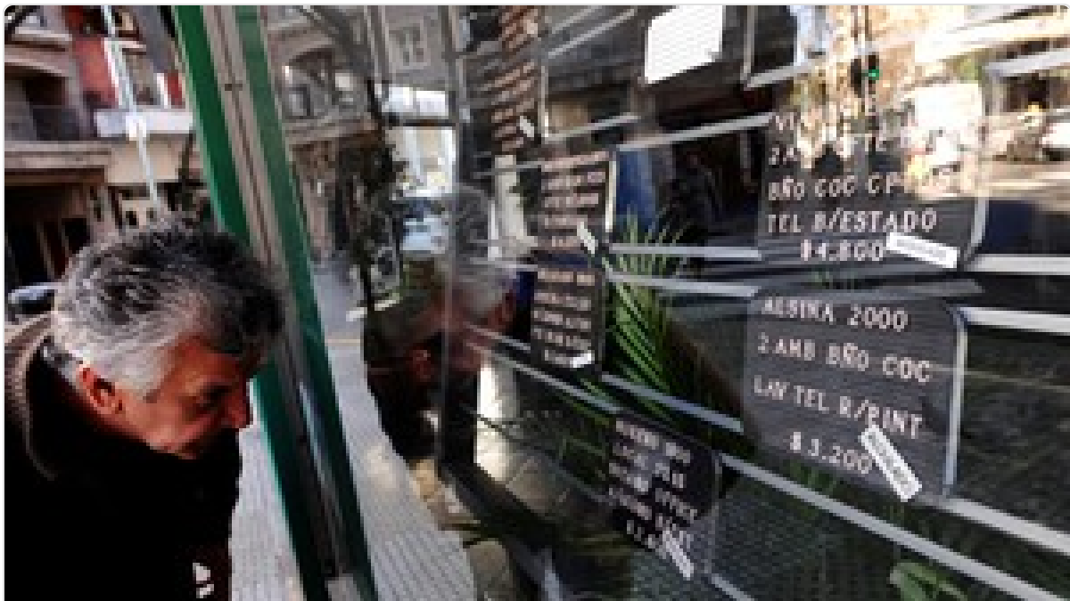
Créditos hipotecarios UVA: cuáles son los requisitos y de cuánto serían las cuotas