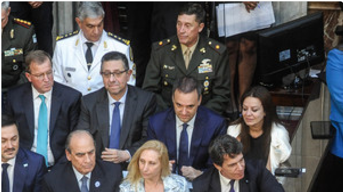
En la semana más intensa del Gobierno, Javier Milei bajó línea para desactivar internas: "Al que hace una operación, lo echo"