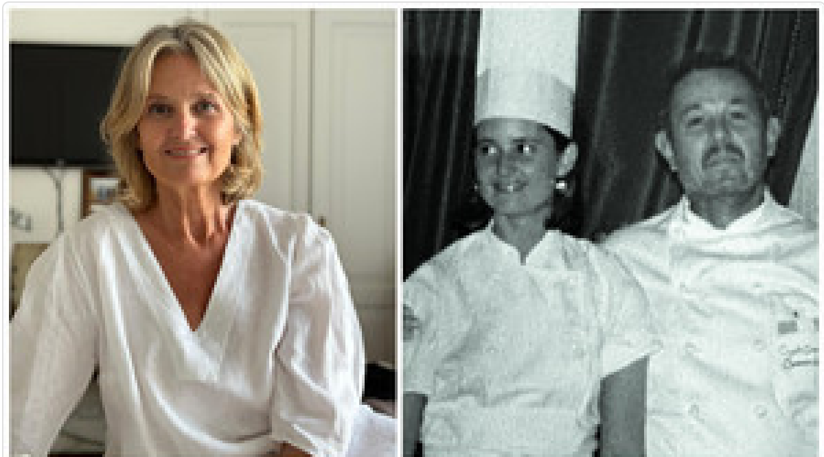
La hija del Gato Dumas revela el costado menos conocido del chef más revolucionario