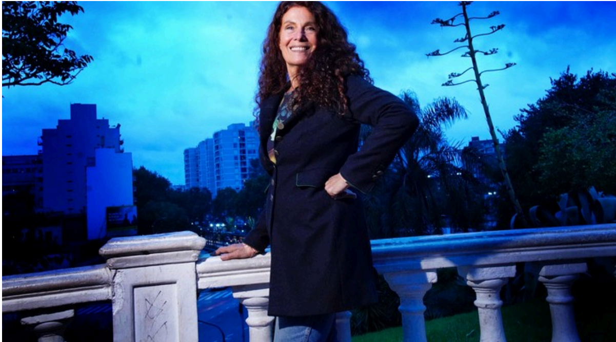
Katja Alemann a los 66 años, siempre bella y talentosa.

En la actualidad, ya siendo una mujer bien madura y con los ideales a flor de piel, la ex tapa de Playboy y socia del recordado empresario de rock Omar Chabán en los inicios del boliche Cemento, se apoya en la música para declamar un mensaje de búsqueda de felicidad , en tiempos de crisis socioeconómica en Argentina.